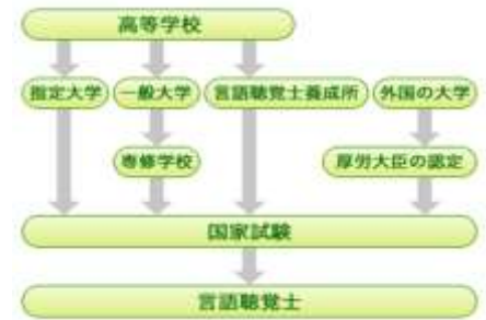
図 1.言語聴覚士になるための流れ

ごく一般的な流れを図 1 を参考に説明します。高校を卒業後、文部科学大臣が指定する大学（4 年制、3 年制短大）、または、厚生労働大臣が指定する言語聴覚士養成所（3 年ないし 4 年制の専修学校）に入学し、必要な知識と技能を修得して卒業する必要があります。卒業後、毎年 1 回開催される言語聴覚士国家試験に合格し、厚生労働大臣から免許を受けると、言語聴覚士として働けるようになります。