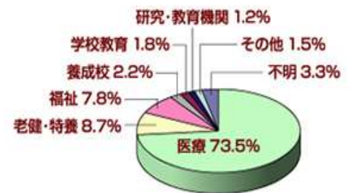
図 2.言語聴覚士の働いている領域

言語聴覚士が働いている場所はさまざまですが、2015 年度の内訳は図 2 の通りです。医療の領域ではリハビリテーション科や耳鼻咽喉科などがある病院、介護・福祉の領域では老人保健施設や障害者福祉センター、発達・療育の場面では通園施設、学校などがあります。最近では、言語聴覚士が患者さんの自宅に伺う訪問リハビリテーションも盛んになってきており、活躍の場が広がってきています。