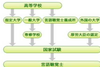
図1. 言語聴覚士になるための流れ

ごく一般的な流れを図1を参考に説明します。高校を卒業後、文部科学大臣が指定する大学（4年制、3年制短大）、または、厚生労働大臣が指定する言語聴覚士養成所（3年ないし4年制の専修学校）に入学し、必要な知識と技能を修得して卒業する必要があります。卒業後、毎年1回開催される言語聴覚士国家試験に合格し、厚生労働大臣から免許を受けると、言語聴覚士として働けるようになります。