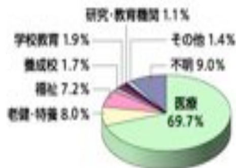
図2. 言語聴覚士の所属機関

言語聴覚士が働いている場所はさまざまですが、2017年度の内訳は図2の通りです。医療の領域ではリハビリテーション科や耳鼻咽喉科などがある病院、介護・福祉の領域では老人保健施設や障害者福祉センター、発達・療育の場面では通園施設、学校などがあります。最近では、言語聴覚士が患者さんの自宅に何う訪問リハビリテーションも盛んになってきており、活躍の場が広がってきています。